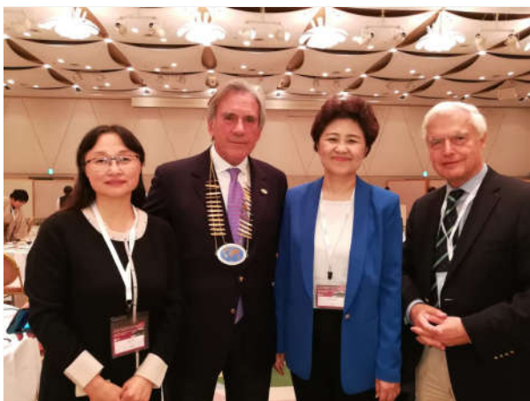
2017年11月, 日本京都, 尚红教授当选WASPaLM西太平洋区主任