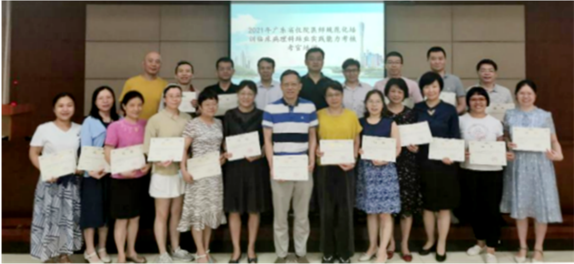
临床病理科结业实践能力考核考官培训

统一考核工具，为考核做好公平保障。为实现OSCE考核客观化、有序化、结构化，统一使用软件系统进行阅片、信息化评分系统进行判分；统一的考核工具，保障考核过程公平、公正、平稳、有序。