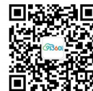
扫描关注微信公众平台