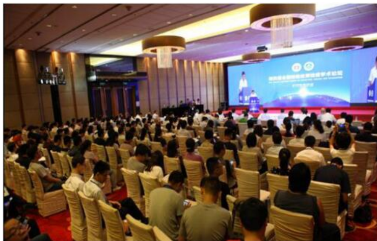
第四届全国检验检测检疫学术论坛现场

国家质检总局党组成员、副局长李元平, 中国科学技术协会党组成员兼学会学术部部长宋军出席开幕式并致辞。出席开幕式的还有中国工程院院士、传染病预防控制国家重点实验室主任徐建国, 国家质检总局科技司副司长周举文, 国家质检总局发展研究中心副主任李明刚, 科技部政策法规与监督司综合与政策处处长侯琼华, 中国毒理学会副理事长付立杰等领导和嘉宾。论坛开幕式由中国检验检疫科学研究院院长李新实主持。论坛主旨报告由中国检验检疫科学研究院党委书记张立、副院长兼总工程师陈颖主持。