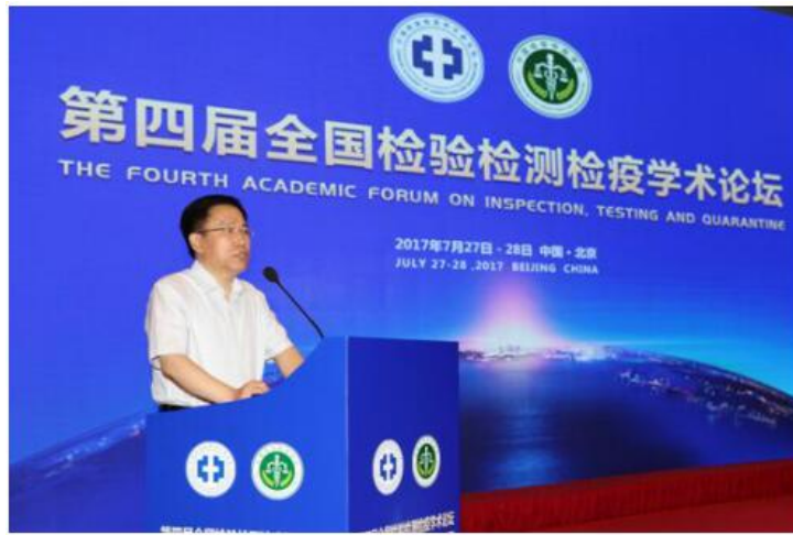
国家质检总局党组成员、副局长李元平致辞

李元平指出，检验检测检疫作为质检科技的重要组成部分，与标准、计量、认证认可共同组成了世界公认的质量技术基础，其肩负着建设质量强国和科技强国的光荣使命，在提升国家质量总体水平、促进经济社会持续健康发展方面发挥着重要基础作用。当前，我们正处在一个以创新为荣，以质量为先的时代，推进科技创新和质量提升成为建设科技强国和质量强国的重大举措和重要抓手。质检科技又一次站在新的历史发展关键节点。