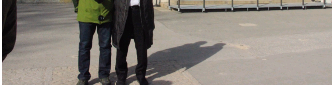
中国学员与Shimon Sakaguchi教授在Schloss Linderhof的合影