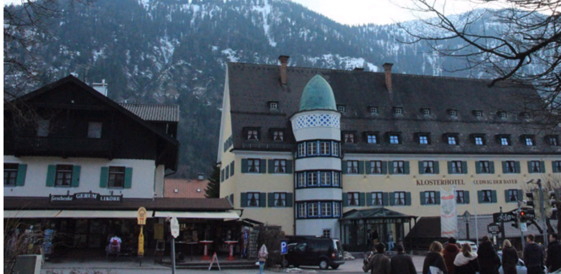
坐落于阿尔卑斯山脚下的酒店