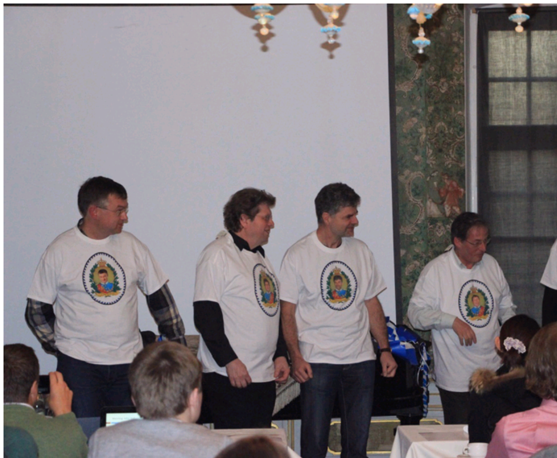
Spring school 10周年纪念仪式，图为给发起人穿10周年纪念衫