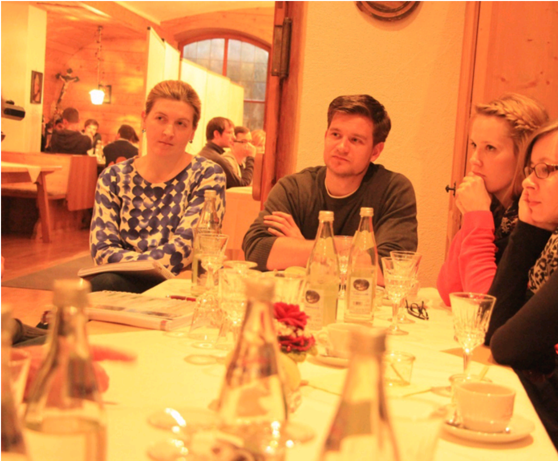
Question & answer环节，学员耐心地听取授课者的讲解