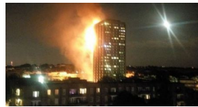
伦敦公寓大火已致12人遇难 数字预计仍将上升