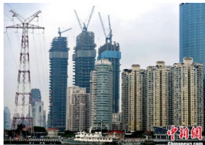
中国经济是否会探底?统计局回应3大经济热点