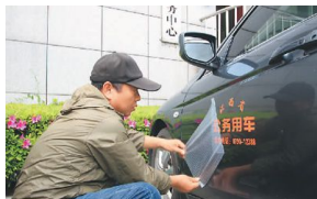
17省份推行公车标识化 广东等省加装GPS定位