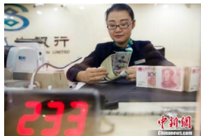
收入分配改革有新动作！国家要激励这些人增收