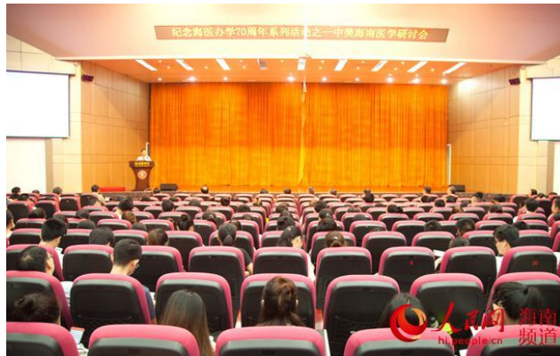
中美海南医学研讨会在海医举行

人民网海口7月11日电 在海南医学院建校70周年之际，中美海南医学研讨会在海医举行，来自中美的专家学者、医生代表及师生600多人参加研讨会。