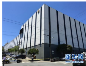
美国旧金山14日发生一起枪击事件 已致4人死亡