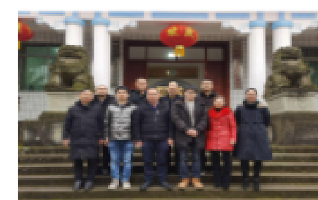
甘蔗研究所 2022-02-23 10:38