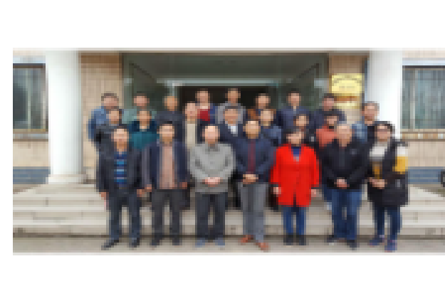
水稻研究所 2022-02-25 10:39