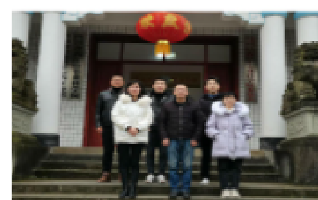
数字农业研究中心 2022-02-28 10:49