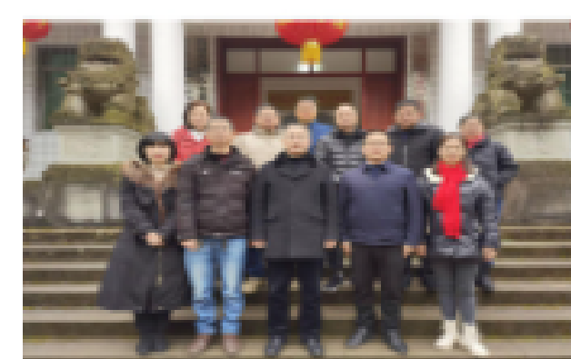
小麦研究所 2022-02-24 10:39