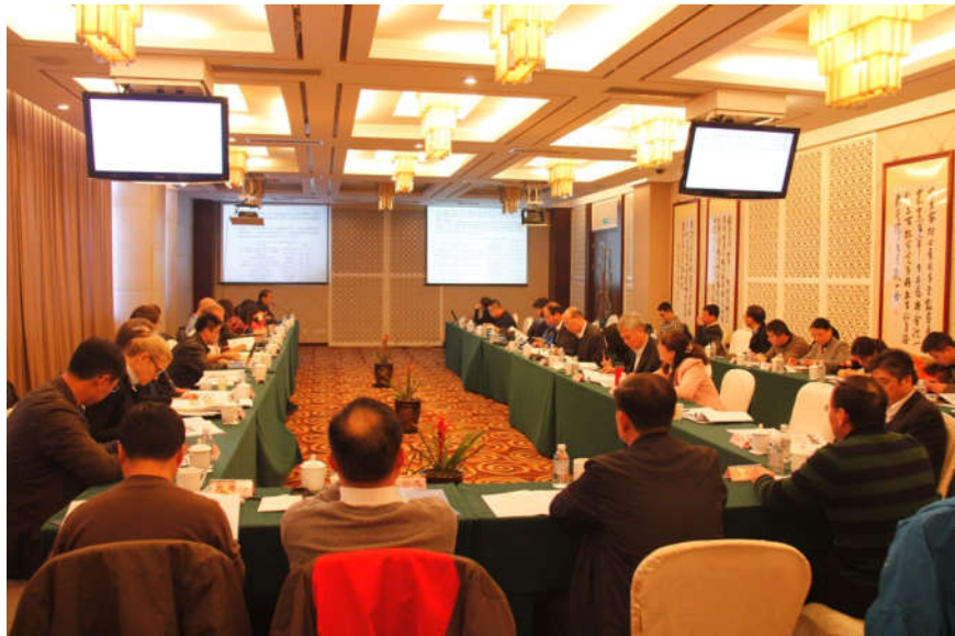
3月15日，由中国水产学会与美国大自然保护协会联合主办，中国水产科学研究院东海水产研究所承办的可持续渔业与海洋生态系统修复国际研讨会在上海召开，来自国内外的30余名专家参与了本次会议。