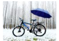
【美丽华农】2016年的第一场雪