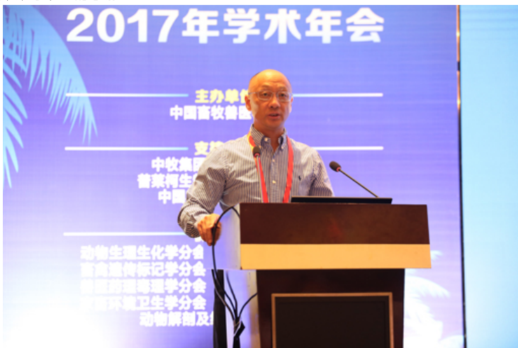
学会理事长黄路生院士致开幕词

本次年会的成功举办，得到了业务主管部门农业部、科技部、中国科协和支撑单位中国牧工商（集团）总公司、北京大北农业科技集团股份有限公司、普莱柯生物工程股份有限公司和中国农业大学的关注、支持；得到了天津瑞普生物技术股份有限公司、金宇保灵生物制品有限公司、安琪酵母股份有限公司、雏鹰农牧集团股份有限公司、江西播恩生物集团有限公司及罗牛山股份有限公司、勃林格殷格翰国际贸易（上海）有限公司、广东温氏大华农生物科技有限公司、北京爱德士元亨生物科技有限公司等国内外知名企业的赞助支持；得到海南省农科院畜牧兽医研究所、海南省畜牧兽医学会、海南群鹰会议服务有限公司及学会相关分会的积极协助，再次表示衷心的感谢！