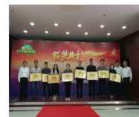
2018寻找中国美丽猪场颁奖典礼圆满..