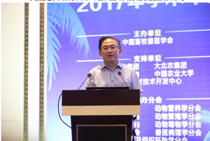
科技部中国农村技术开发中心贾敬敦主任作重要讲话