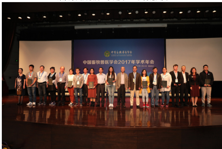
颁发学会2017年学术年会优秀壁报奖