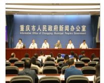
第八届中国畜牧科技论坛新闻发布会在重..