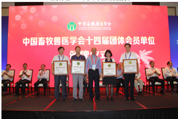
理事长黄路生院士颁发团体会员单位标牌