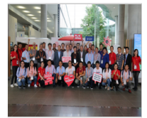
学会组织优秀青年奶牛兽医工作者参加第..