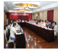
中国畜牧兽医学会2018—2019兽..