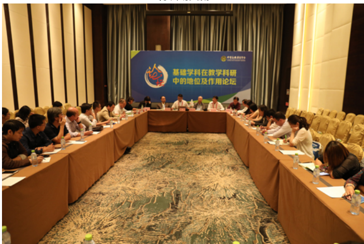
基础学科在教学科研中的地位及作用论坛