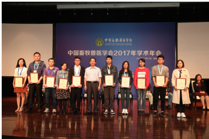
颁发中国畜牧兽医学会奖——优秀论文奖