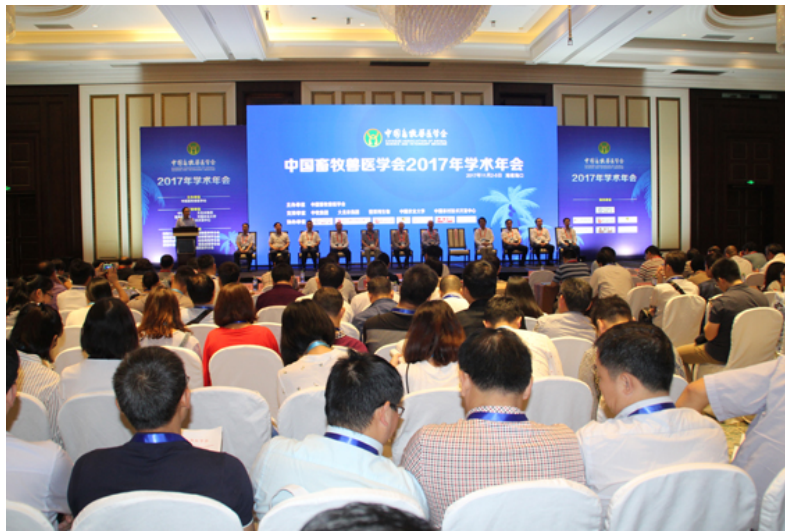
基础为本 交叉融合 创新发展 ——中国畜牧兽医学会2017年学术年会在海口隆重举行

在举国上下深入学习宣传贯彻党的十九大精神,开启全面建设社会主义现代化国家新征程的日子里,中国畜牧兽医学会2017年学术年会于11月2-5日在美丽的椰城——海口市隆重举行。来自全国农业高等院校、科研院所和相关企业的专家、学者、青年科技工作者、企业管理者近800人参加会议。农业部、科技部、国家自然科学基金委、海南省畜牧兽医局等相关单位领导莅临大会。