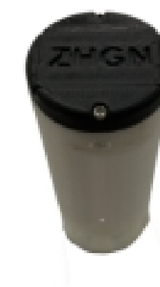
图-奶牛瘤胃酸中毒监测丸

养殖户通过奶牛瘤胃酸中毒监测丸对奶牛健康情况实时监测，减少损失，提高收益20%。