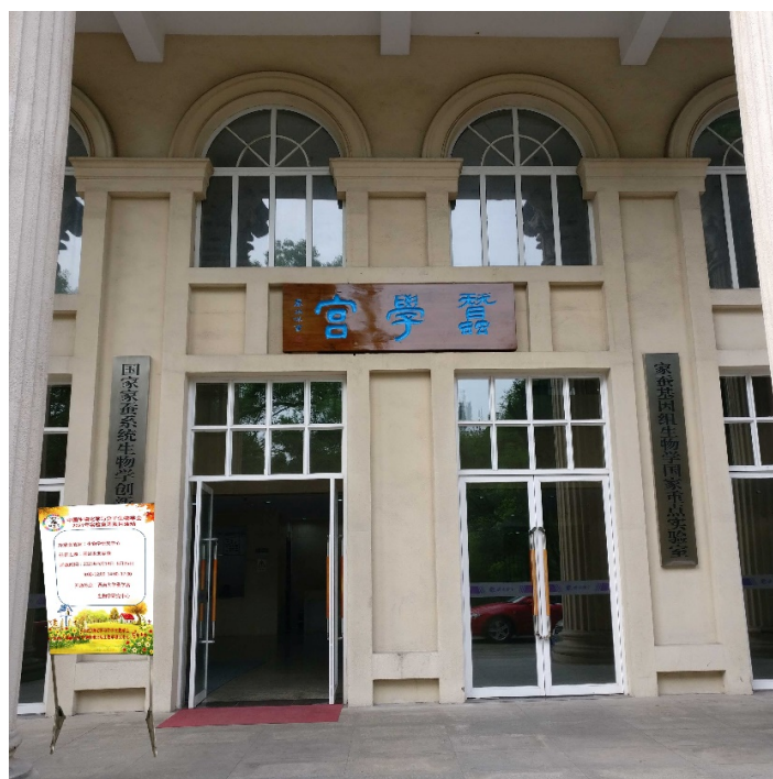
西南大学蚕学宫科普活动宣传

2021年5月18日-25日，中国生物化学与分子生物学会2021年实验室科技开放周活动在西南大学前沿交叉学科研究院生物学研究中心正式拉开帷幕。