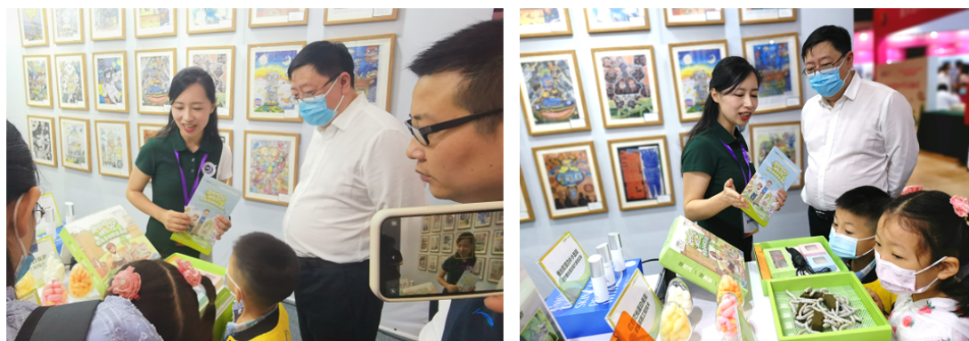
重庆市科协王合清书记考察中心科普展台