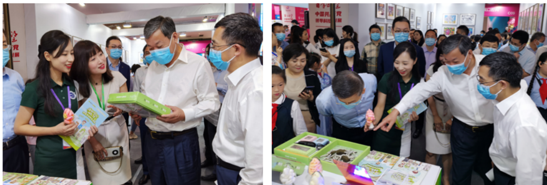
重庆市熊雪副市长考察中心科普展台