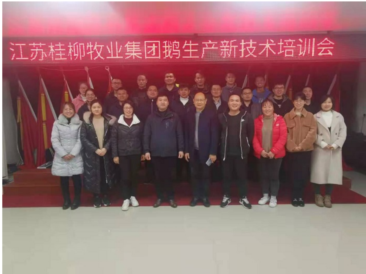
培训人员集体合影