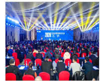
2020羊业发展高级研讨会在天津召开