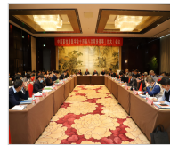
中国畜牧兽医学会十四届八次常务理事