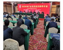
优质肉鸡高质量发展研讨会在宁都顺利召..