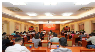
中国林科院各级党组织深入学习《习近平谈治国理政》第四卷