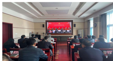
中国林科院组织党员干部观看介绍解读党的二十大报告新闻发布会