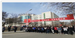
12月25日，我校举办了2019学生冬...