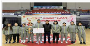
12月17日，校女子篮球队在QBA...