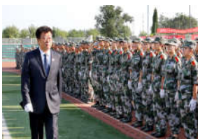
2018级本科生军训阅兵式暨总...