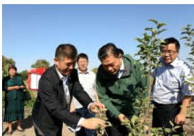
我校吉尔吉斯斯坦“现代农业示范...