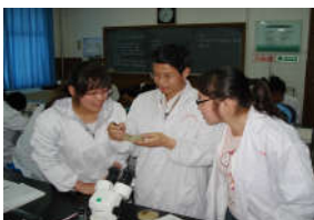
为人师表 以德树人