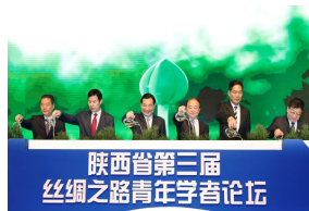
我校承办的陕西省第三届“丝绸之...