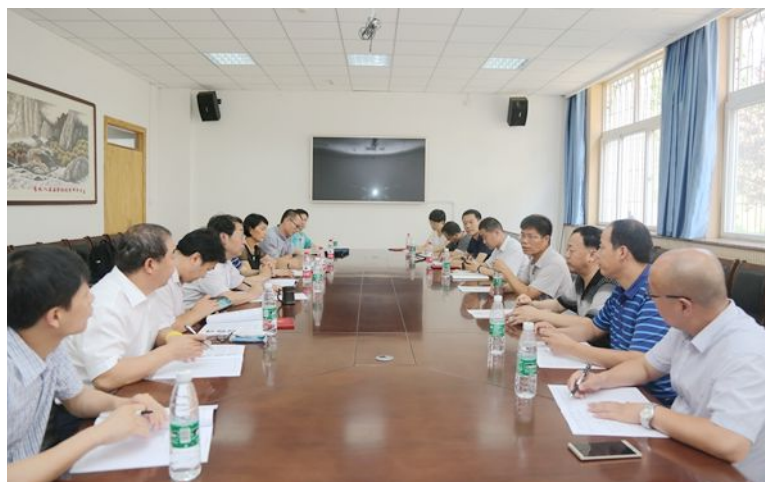
陕西省饲料饲草产业发展战略研讨会会场