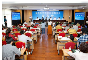
我校西北乡村调查报告在“农民丰...