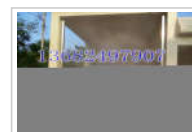
猪场喷雾消毒通道, 汽车消毒通道厂家