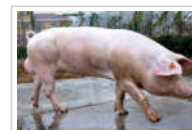
长白公猪—安徽大自然