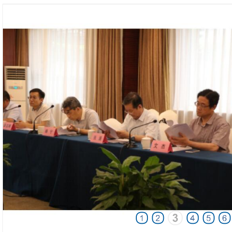
① ② ③ ④ ⑤ ⑥

首页 分会概况 组织机构 分会新闻 学术前沿 通知公告 科学平台 网上办事 联系我们