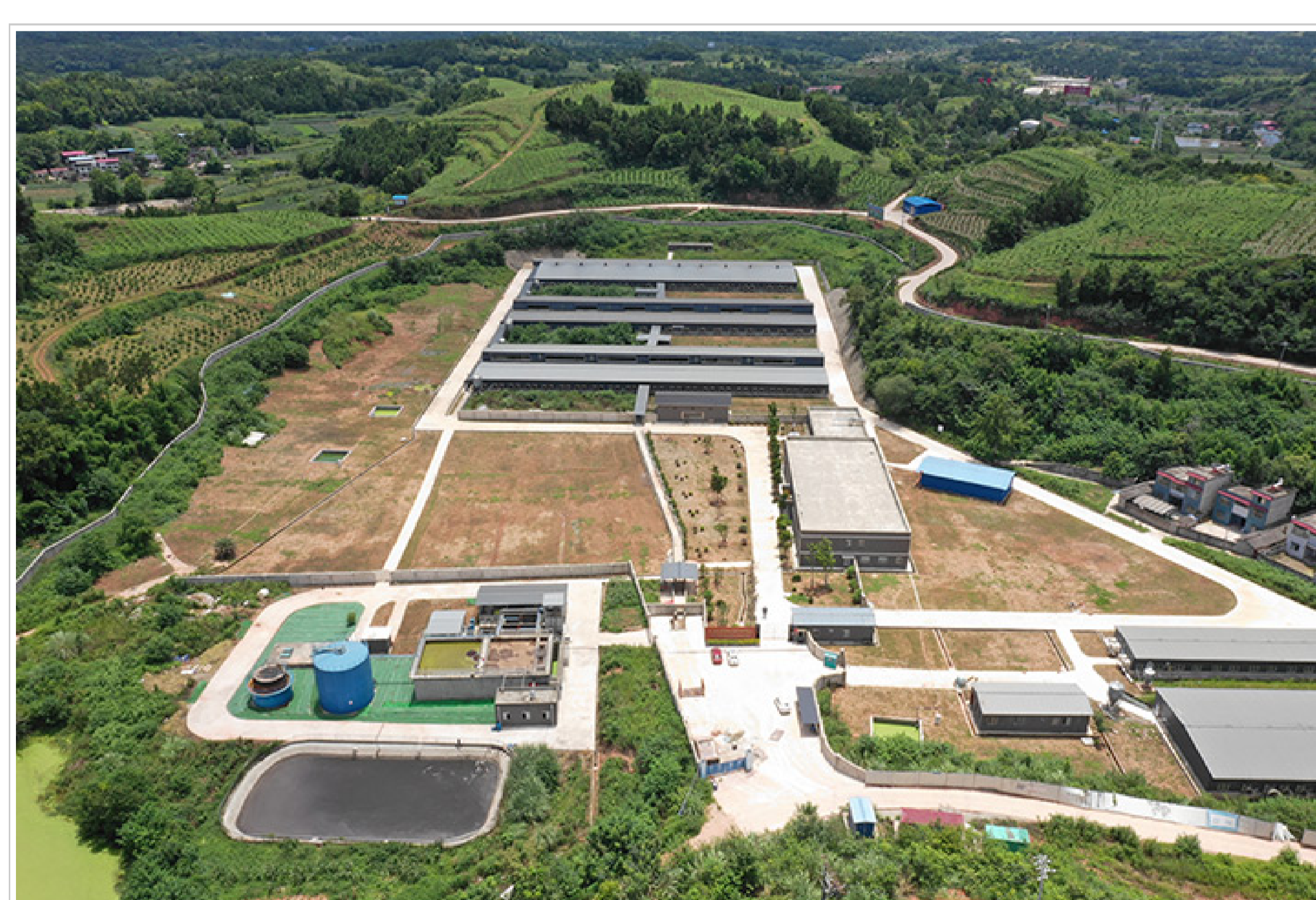
猪育种科研基地（简阳）