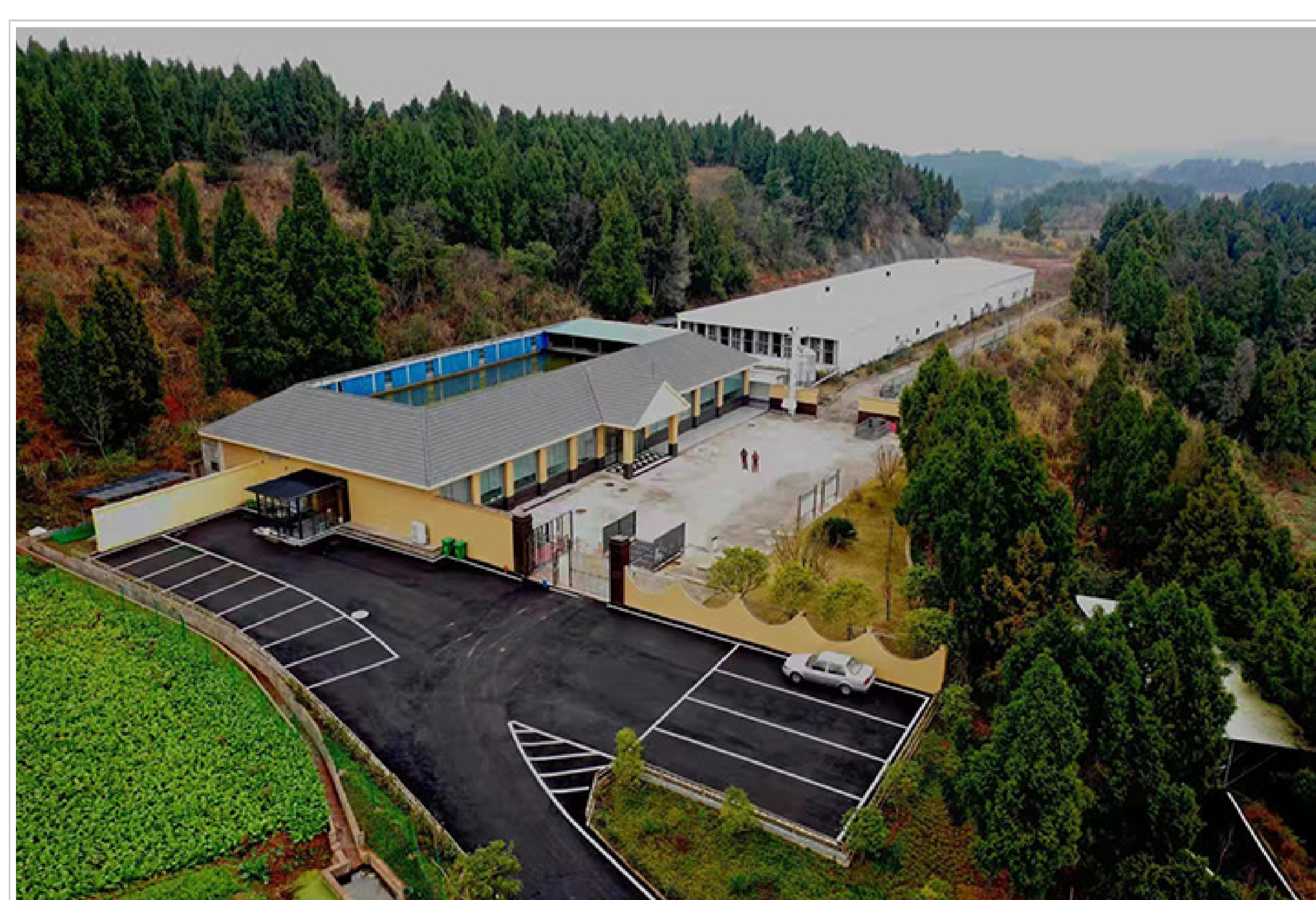
种猪基因交流中心（乐至）