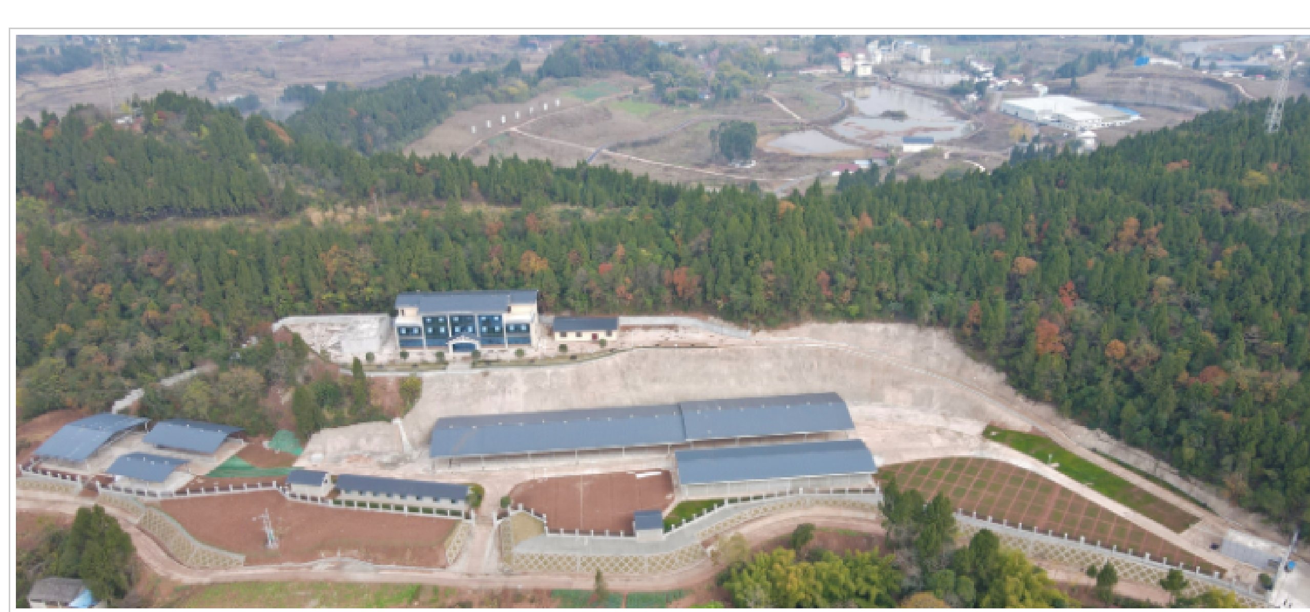
优质肉牛和饲草育种科研基地（乐至）