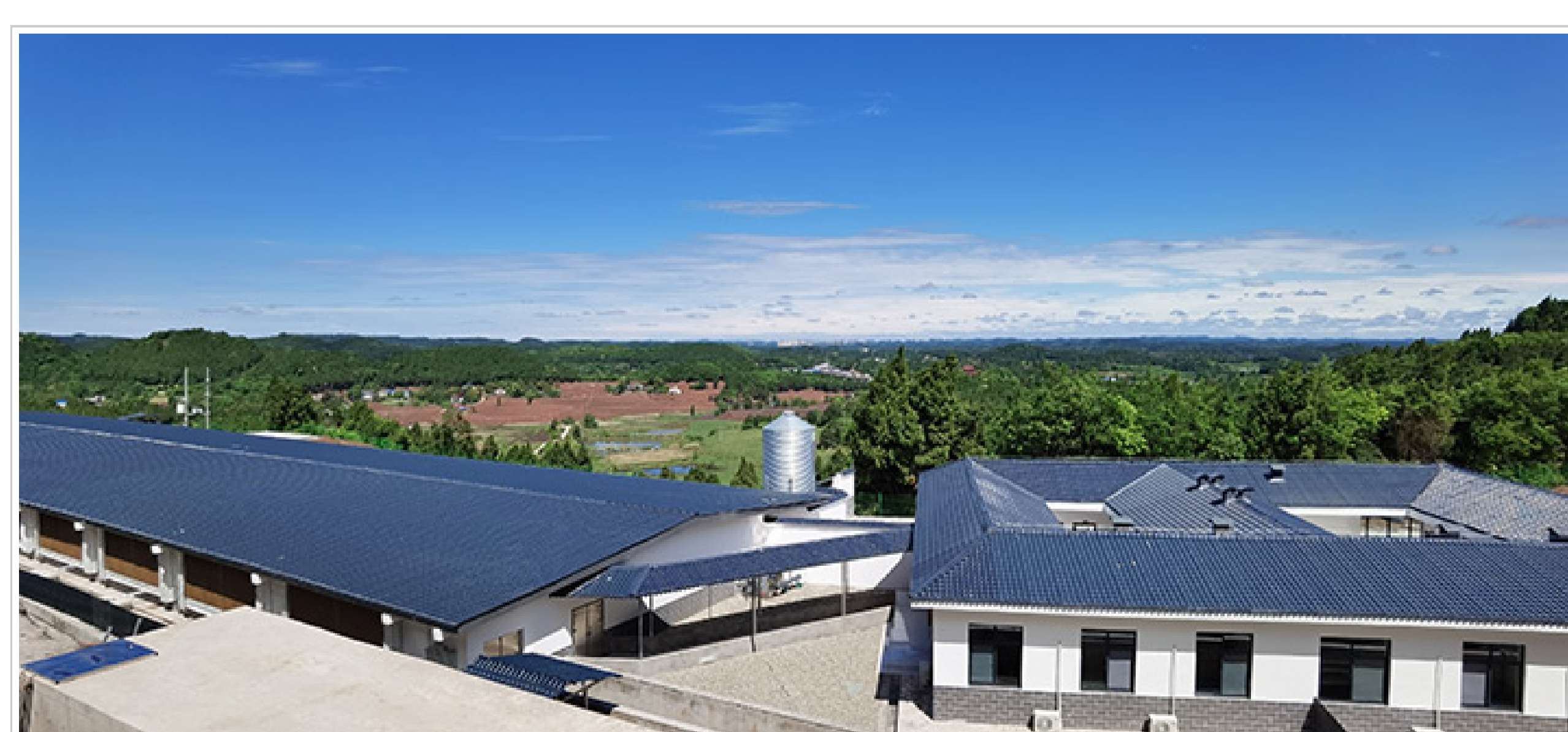
种猪质量性能测定中心（乐至）