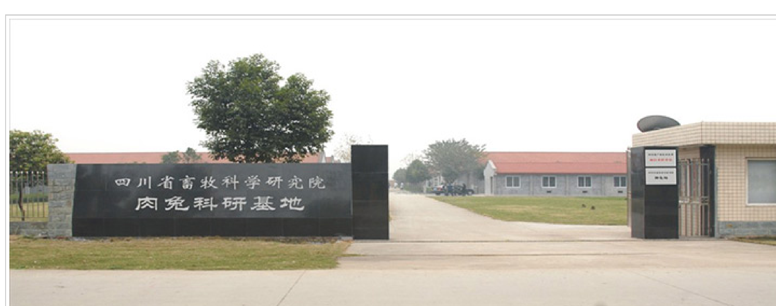
肉兔育种科研基地（大邑）