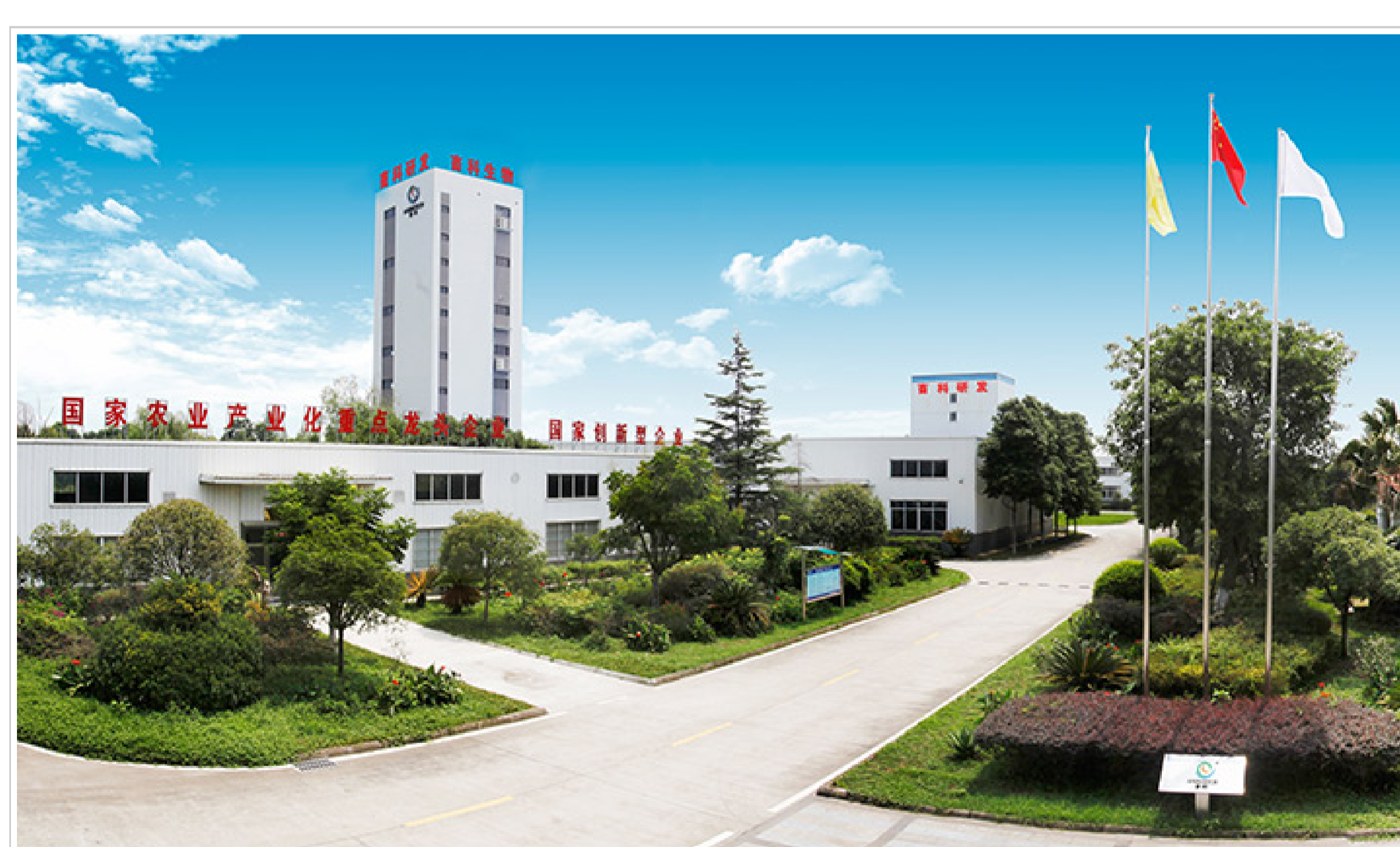
生物饲料研发基地（大邑）