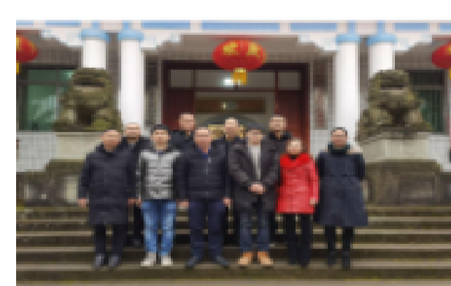
甘蔗研究所 2022-02-23 10:38