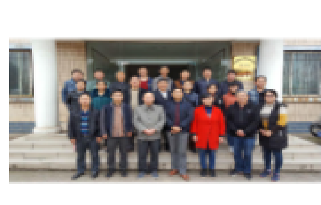
水稻研究所 2022-02-25 10:39