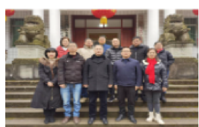
小麦研究所 2022-02-24 10:39