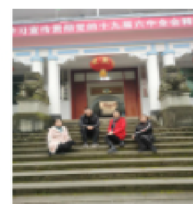
中心实验室 2022-03-01 10:48