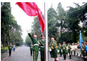
学校举行纪念“九一八”升旗仪式