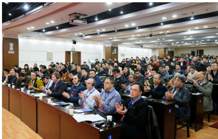
来自11个国家260余名专家学者参会研讨交流