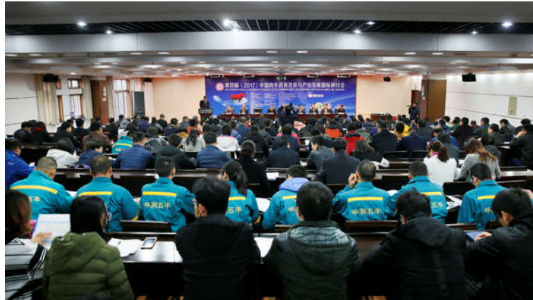
第四届中国肉牛选育改良与产业发展国际研讨会在我校举行

来源：党委宣传部 | 作者：李晓春/文 支勇平/图 | 发布日期：2017-11-30 | 阅读次数：1565