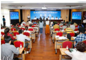
我校西北乡村调查报告在“农民丰...