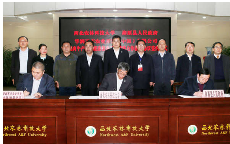
我校与海原县及华润五丰公司签署《高端肉牛产业发展政校企三方战略合作框架协议》