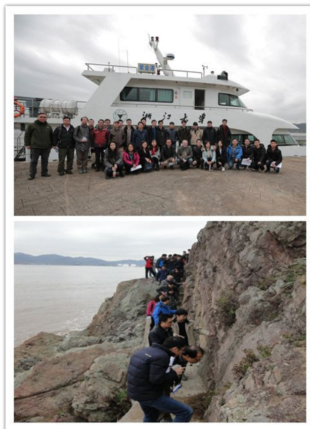
摘箬山岛野外地质考察-地质剖面考察、火山岩相考察、发现岩脉