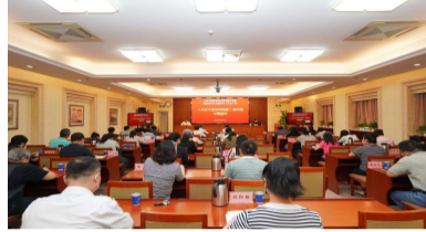
中国林科院各级党组织深入学习《习近平谈治国理政》第四卷