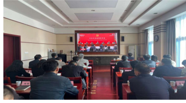
中国林科院组织党员干部观看介绍解读党的二十大报告新闻发布会