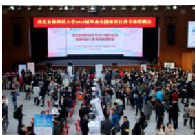
园林设计专场招聘会提供岗位2...