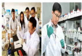
我校2位教授入选科技部创新人才...