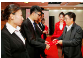
助力国家乡村振兴战略 加快世...