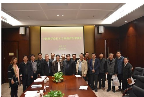
杉木专业委员会一届二次常委会

会议期间还召开了杉木专业委员会一届二次常委会, 会议讨论审议通过了杉木专业委员会2017年度工作报告; 同意扩大代表范围, 特别是邀请杉木加工行业的代表参加, 并一致同意下届学术研讨会在广西柳州召开。