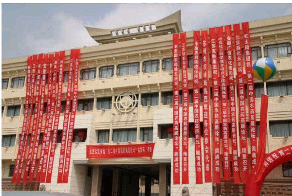
大会场外—苏州会议中心