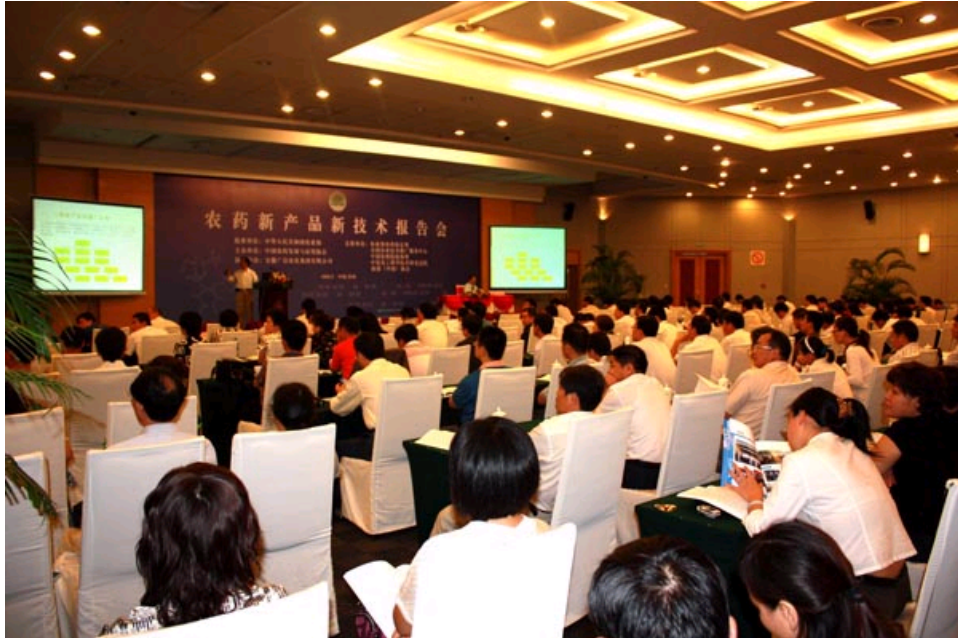
第一分会场—新产品新技术报告会