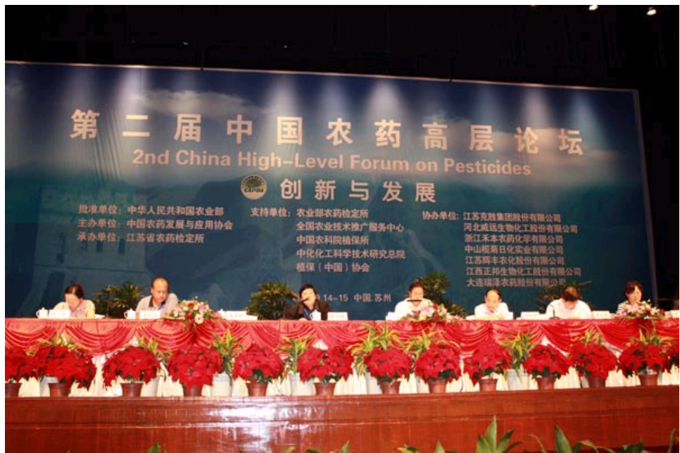
主会场—政策对话会