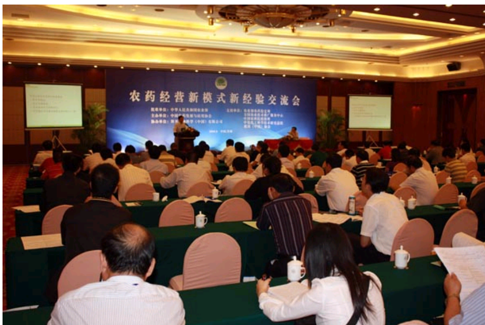
第二分会场—农药经营新模式新经验交流会