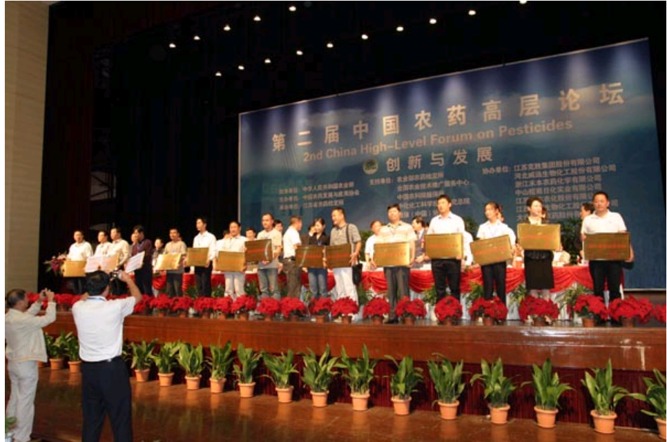
颁发“放心农药经营单位”牌匾及证书