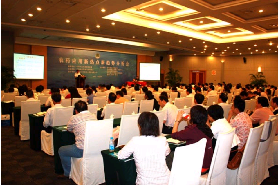
第三分会场—农药应用新热点新趋势分析会