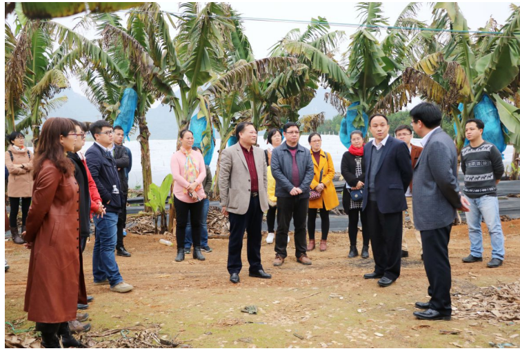
生物所 周维供稿/黄曲燕供图 韦弟审核 责任编辑：薛臣艺