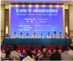
第二届中国（广西）—东盟农业