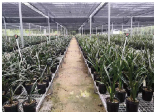
西阳国兰示范基地