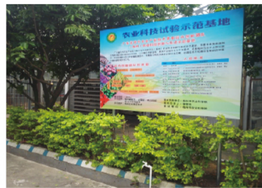
广东省花卉创新团队梅州示范基地