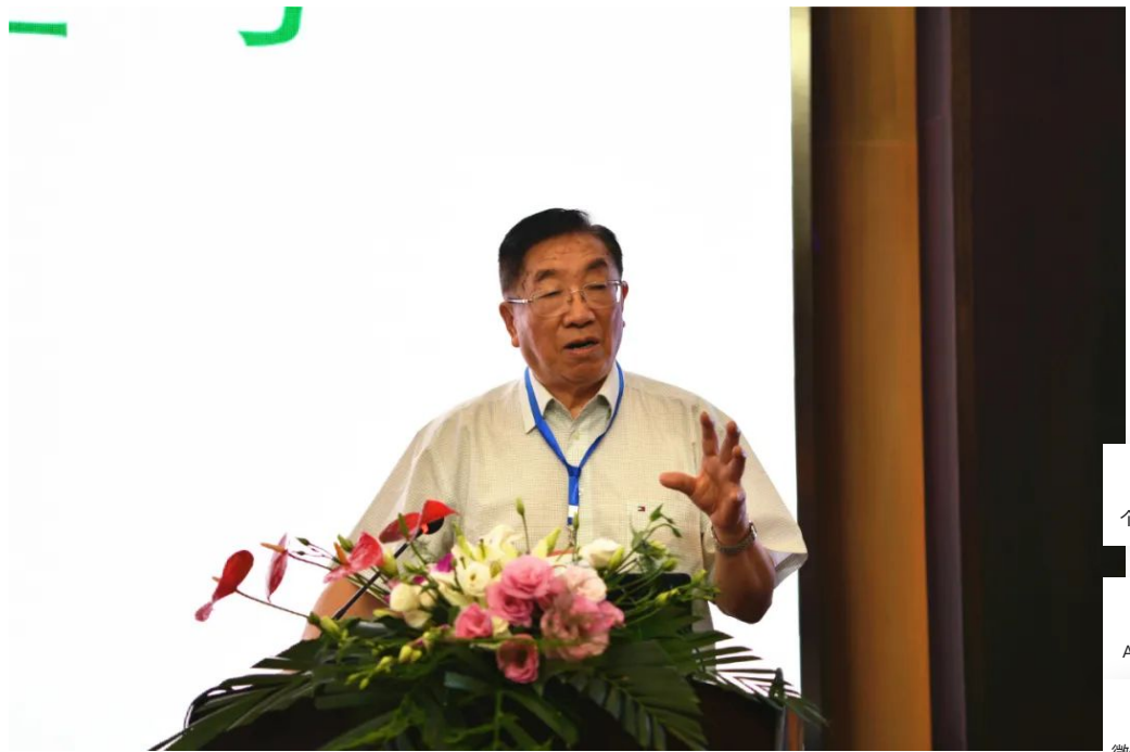
陈宗懋院士作《中国茶产业的质量安全和绿色防控》的报告