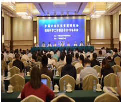
自治区副主席方春明出席中国农