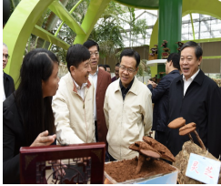
自治区主席陈武到我院调研指导