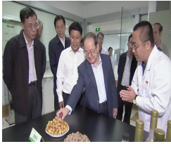
自治区党委书记鹿心社到我院调