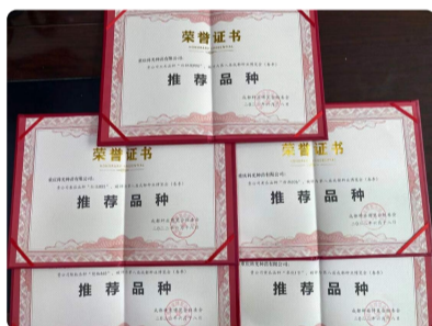
我院5个新品种获成都种业博览会...