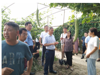
我院科技特派团举办蔬菜新品种、...