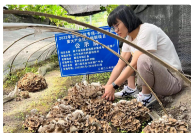
我院林下食用菌栽培技术花开城口