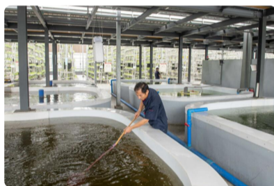
养鱼不换水、种菜不施肥 这样的...