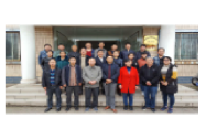
水稻研究所 2022-02-25 10:39