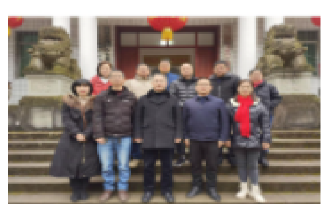
小麦研究所 2022-02-24 10:39