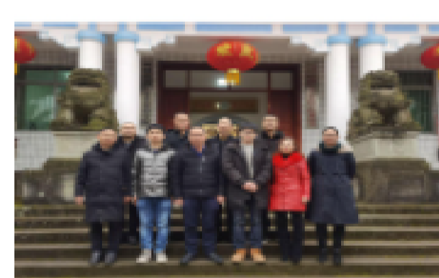
甘蔗研究所 2022-02-23 10:38