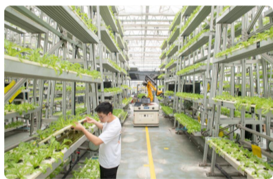
种植业结合养殖业 重庆市农科院...