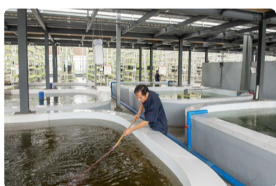
养鱼不换水、种菜不施肥 这样的...