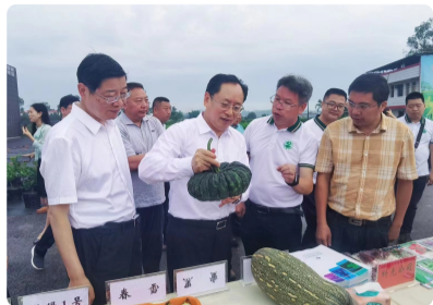
2022成渝地区双城经济圈农业科...