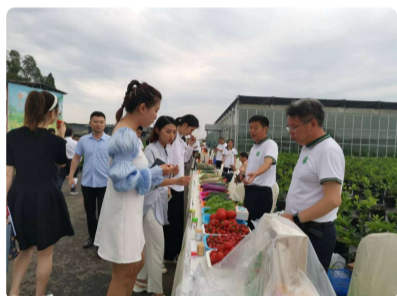
2022成渝地区双城经济圈农业科...