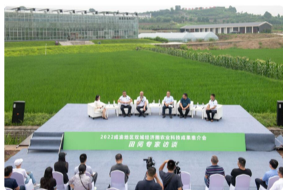
2022成渝地区双城经济圈农业科...