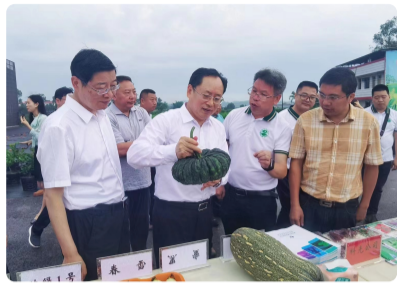
2022成渝地区双城经济圈农业科...