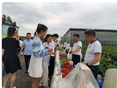
2022成渝地区双城经济圈农业科...