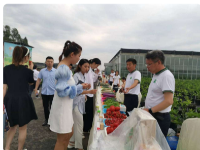
2022成渝地区双城经济圈农业科...