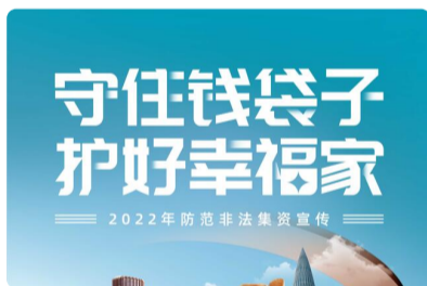
守住钱袋子 护好幸福家