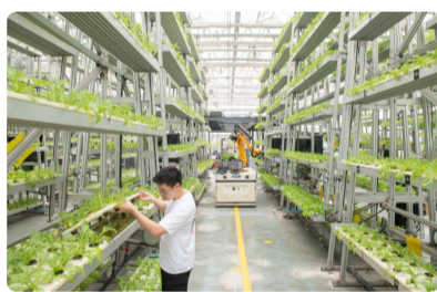
种植业结合养殖业 重庆市农科院...