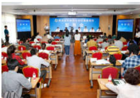
我校西北乡村调查报告在“农民丰...