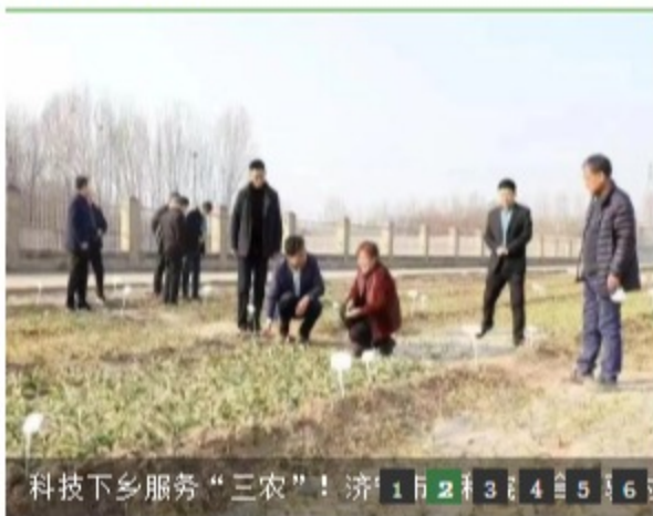
科技下乡服务“三农”! 1 2 3 4 5 6