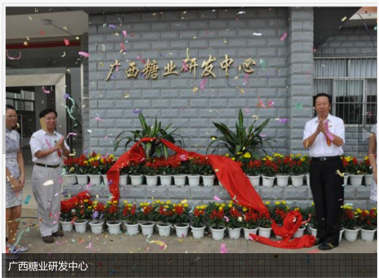
广西糖业研发中心