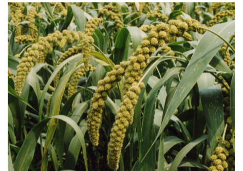
高产优质夏谷新品种——济谷13号