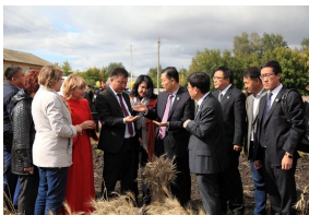
李兴旺书记率团访问哈萨克斯坦高...