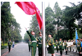
学校举行纪念“九一八”升旗仪式