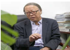
【西农奋斗者】 (12) 丹心一片...