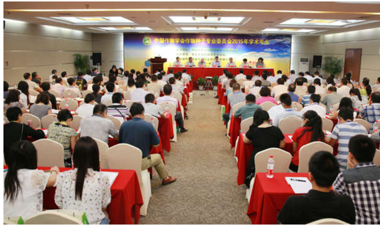
中国作物学会作物种子专业委员会2015年学术年会在杨凌召开

来源: 党委宣传部 | 作者: 张琳 李向拓/文 支勇平/图 | 发布日期: 2015-08-18 | 阅读次数: 2318