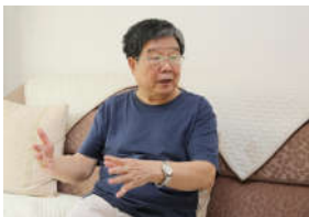
【西农奋斗者】 (11) 丹心一片...