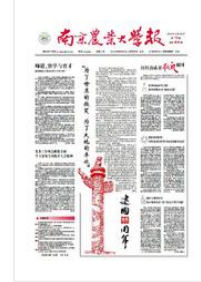
南京农业大学报 (总第898期)