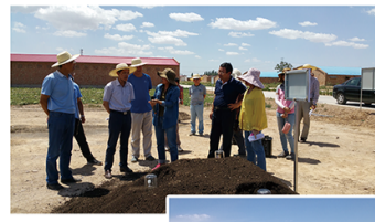
微生物肥料压砂西瓜示范