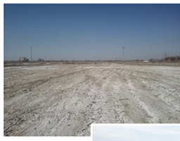
银北盐碱地改良前后对比