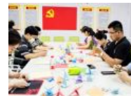
折纸叠叠寄相思: 教职 工为毕业生