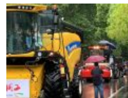
“异曲同工”: 师生融 乐情更浓