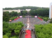
狮山大爱伴君行: 2020年毕业典礼