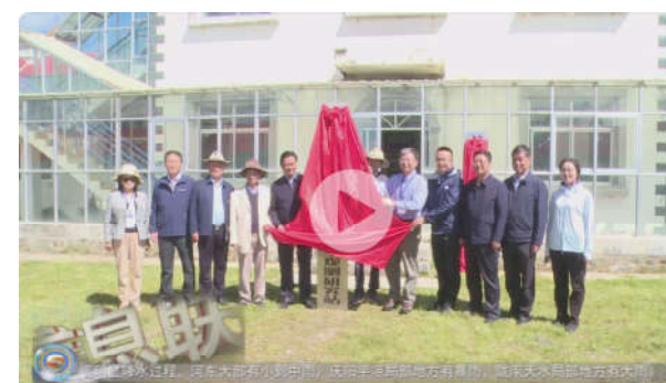
【甘肃经济频道-经济信息联播】科学观测研究...