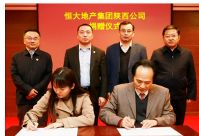
恒大地产集团向我校捐赠2000...