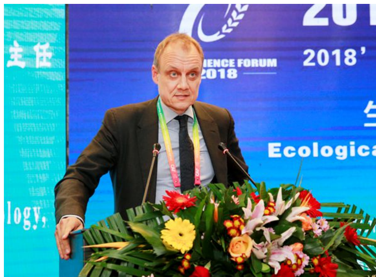
英国利兹大学社会学系主任艾德里安·法维尔教授致辞

吉尔·赛冬表达了加拿大与各方合作的期盼。他说，2018年杨凌国际农业科技论坛让一批志同道合的国家和机构携手建立起合作关系，让大家有了创新发展的能力和机会，并令参与合作的人获益。