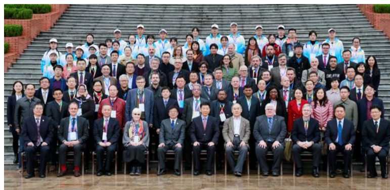
与会来宾合影留念

2018杨凌国际农业科技论坛以“生态农业：绿色·优质·高效”为主题，将重点关注解决农业生产造成的土壤侵蚀、能源危机、环境污染等问题。在为期3天的会期中，围绕作物绿色生产与产业发展、动物生物技术与健康养殖、农业资源高效利用与绿色发展、乡村社会治理与精准扶贫、森林资源保育与生态安全等专题，中外专家将通过65场分会报告，分享各国实践经验，找寻依托“生态农业”解决农业农村发展问题的方法，协力突破生态农业发展领域重大科学前沿和关键技术难题。