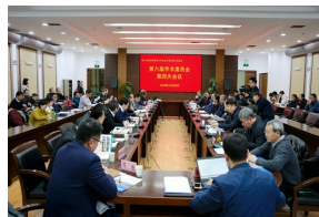
15位科学家为“国重室”出谋划...