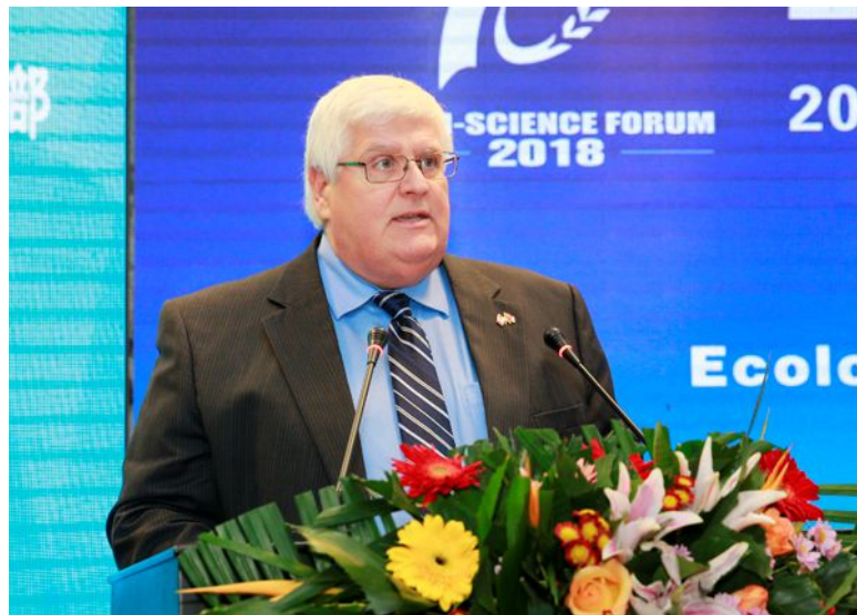
加拿大农业与农业食品部助理副部长吉尔·赛冬致辞

吉尔·赛冬表达了加拿大与各方合作的期盼。他说，2018年杨凌国际农业科技论坛让一批志同道合的国家和机构携手建立起合作关系，让大家有了创新发展的能力和机会，并令参与合作的人获益。