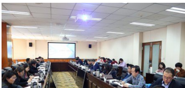
兰州大学召开本学期第二次教学工...