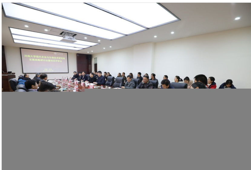
研究院成立大会现场